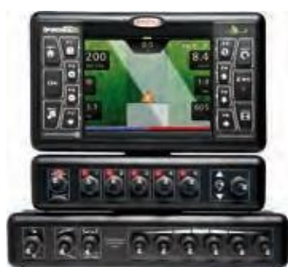
CALCULATOR BRAVO 400S cu GPS