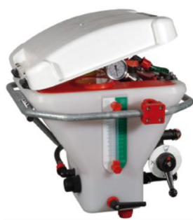
MIXER ECOBOX 25L