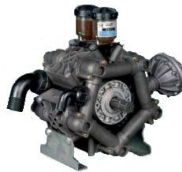
POMPA IMOVILLI D 245S